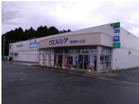
ウエルシア薬局珠洲野々江店

これにより、お客様はウエルシア薬局珠洲野々江店において、珠洲市が主体となり発行するデジタル化されたポイント「珠洲トチポ」を使用してお買い物がいただけます。