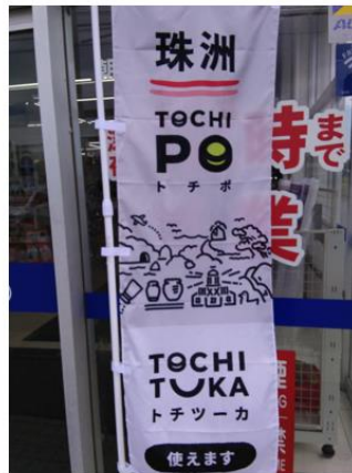
トチツーカー取り扱いに関わる設置、掲示物