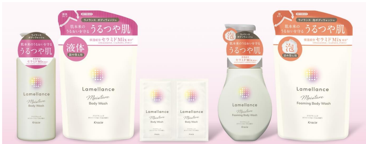
<左から:ボディウォッシュ(ポンプ・詰替用・トライアル)、泡ボディウォッシュ(ポンプ・詰替用)>